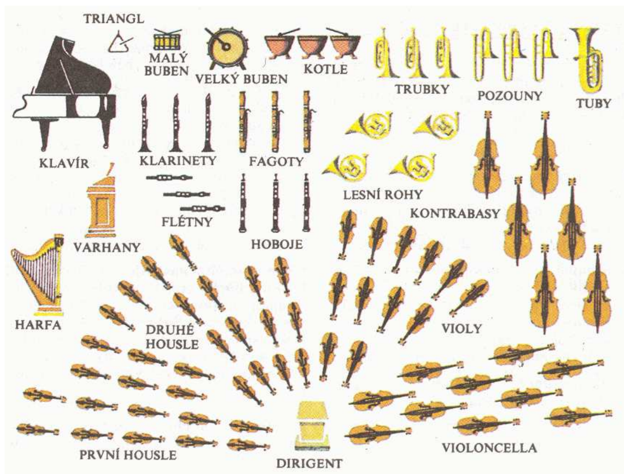
Obr. Symfonický orchestr 2

Orchestr je hudební instrumentální těleso , v němž jsou stejné hudební nástroje zastoupeny více než jednou.